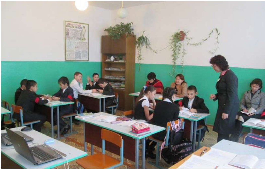
Работа в группе